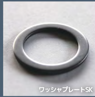
ワッシャプレートSK