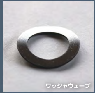
ワッシャウェーブ