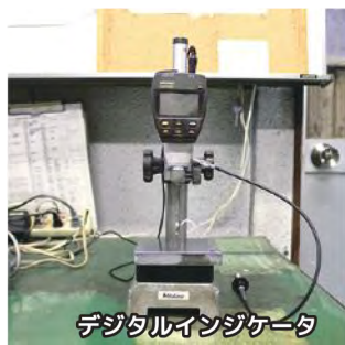
デジタルインジケータ