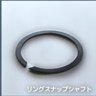
リングスナップシャフト