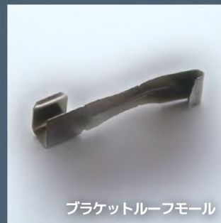
ブラケットルーフモール